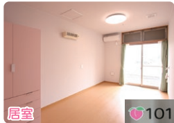
プライバシーを守る快適な個室。 室名札