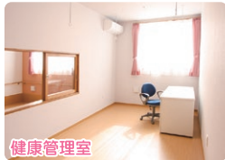
健康に関するご相談を受けます。