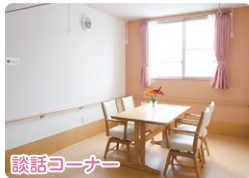
ご面会やご入居者同士の交流の場。