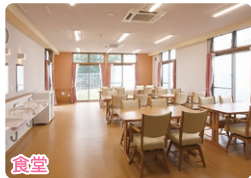
広く開放的な明るい空間。